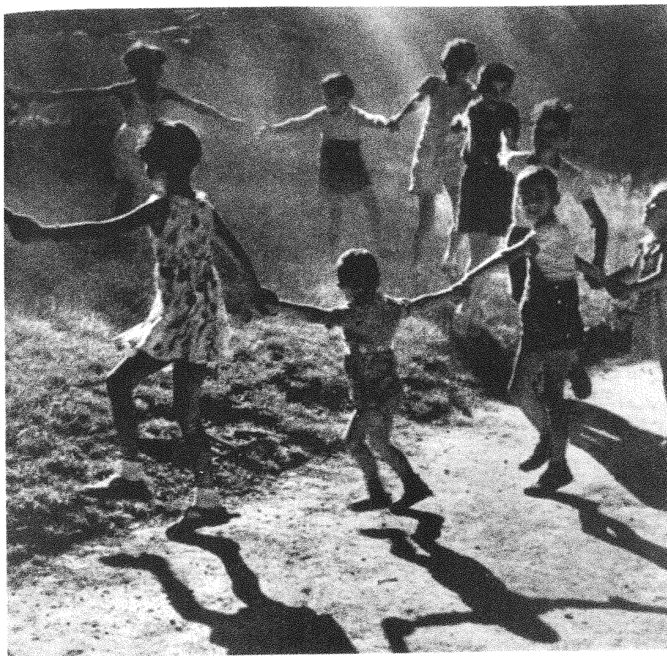
Children playing a game in a field.